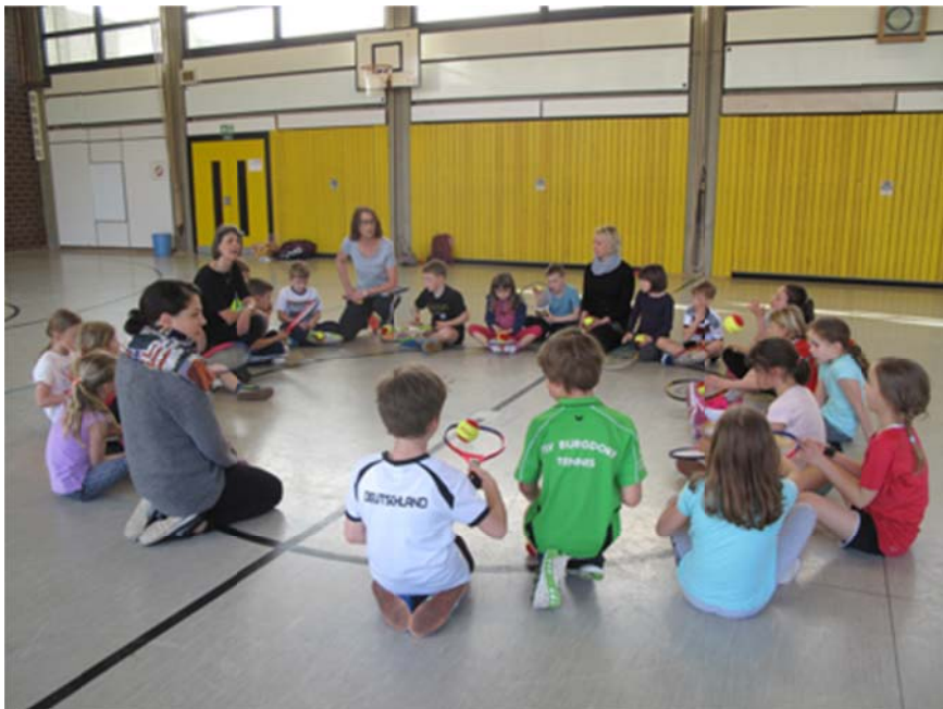
Schultennis-Cup in der Astrid-Lindgren-Grundschule