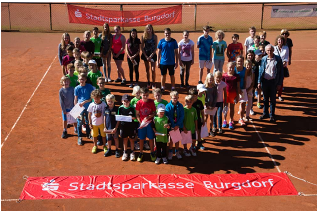
Stadtmeisterschaften 2016 beim Tennisclub TSV Burgdorf

Neben den sportlichen Aspekten fördern wir auch das Zugehörigkeitsgefühl, das Gemeinschaftserlebnis und den Teamgeist der Kinder und Jugendlichen.