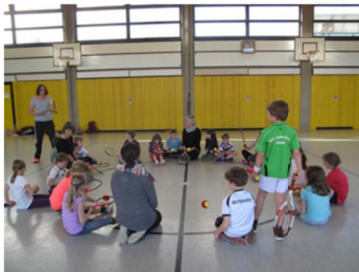
Tennis AG in der Astrid-Lindgren Grundschule 2017