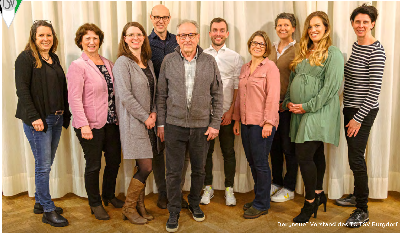
Der „neue“ Vorstand des TC TSV Burgdorf